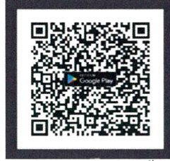
ระบบ Android Ver.8 ขึ้นไป