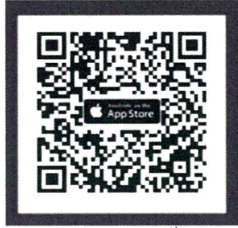
ระบบ IOS 14.5 ขึ้นไป